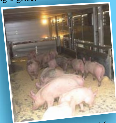
En af transportbilerne indefra.

Ønsker du at købe eller sælge smågrise, så kontakt én af nedenstående salgsledere: